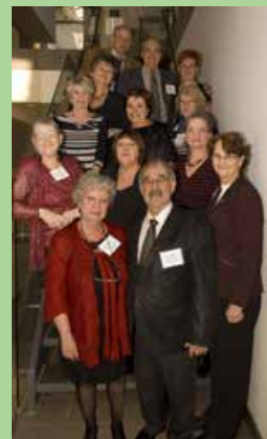
L'équipe de l'accueil