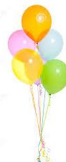
Murielle Lacasse présente de nouvelles retraitées