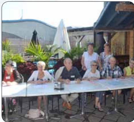
Table des bénévoles