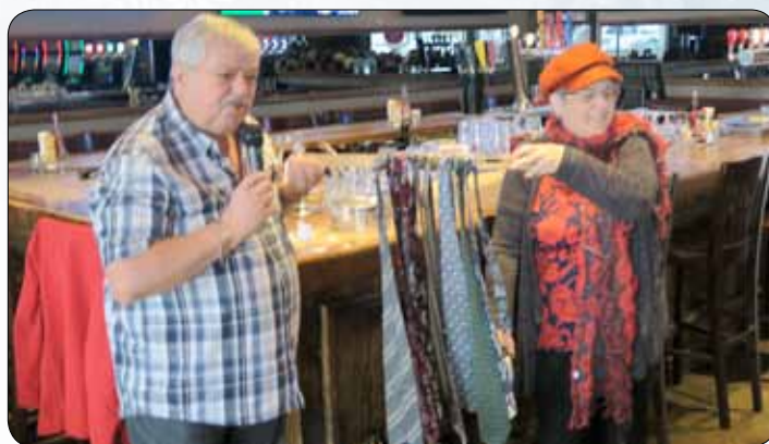
Collecte de cravates : une réussite !