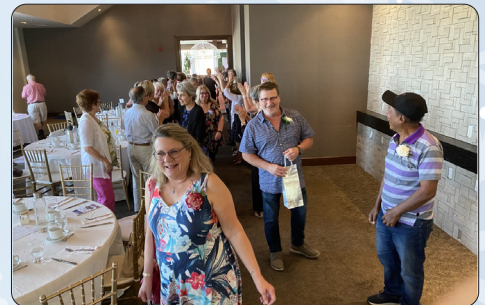
Entrée des nouveaux