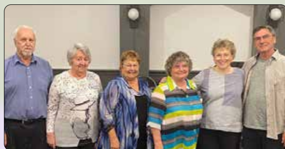
Nouveau conseil élu