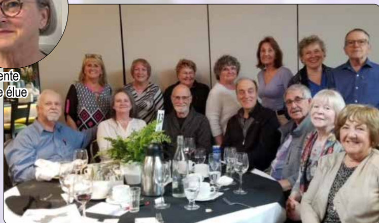
Représentants du secteur