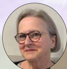
Présidente régionale élue