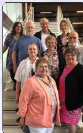
Délégation du secteur