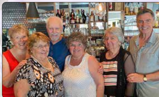
Le conseil organisateur