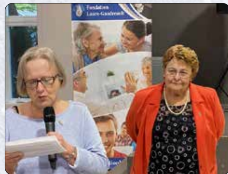
Présidente régionale & sectorielle