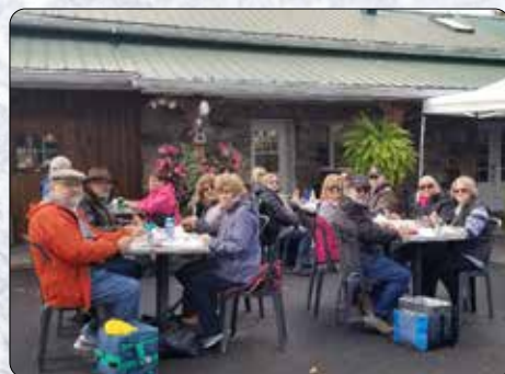
Dîner à l'extérieur