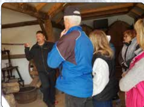
Visite Cidrerie du Minot