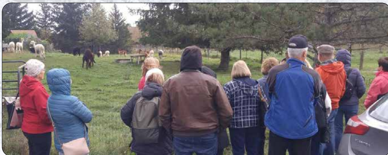
Visite chez AlpagAdore à Saint-Chrysostome