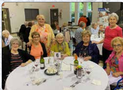
Des personnes colorées